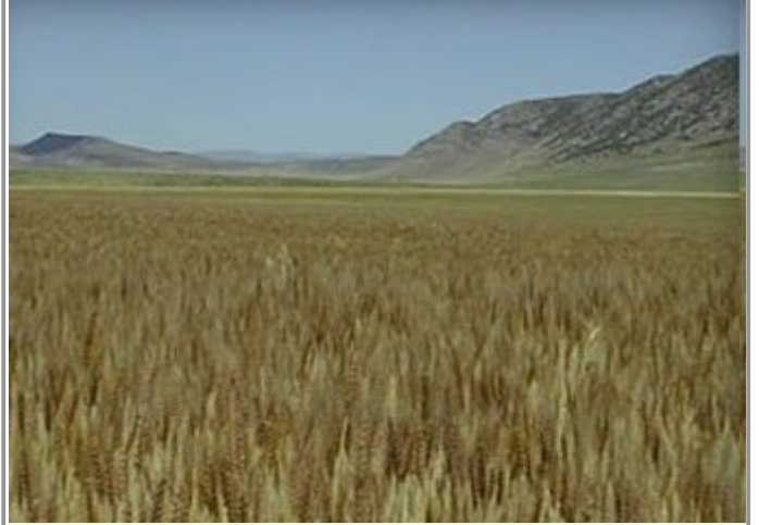
யூபிலி ஆண்டின்போது நிலம் பயிரிடப்படாமல் நிலத்துக்கு ஓய்வு அளிக்கவேண்டும் என்பது தேவ கட்டளை

தேவனது தெய்வானமான வழிநடத்துதல், மூன்று வருடங்களுக்குத் தேவையானவற்றை முன்கூட்டியே ஏற்பாடு செய்திருந்தது. தேவனது அன்பும், பராமரிக்கும் தன்மையும் நமக்கு எவ்வளவு மிகப்பெரிய பாடங்களைக் கற்றுத் தருகிறது. திருச்சபையாராகும்படி அழைக்கப்பட்ட